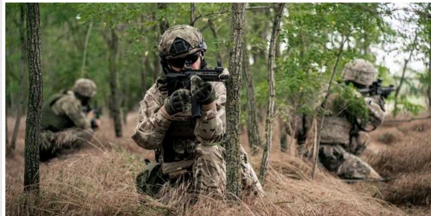
Ситуація на фронті: за добу відбулося 146 бойових зіткнень

Минулої доби на фронті було зафіксовано 146 бойових зіткнень. Російські війська продовжують обстрілювати ракетами позиції українських військових та населені пункти.