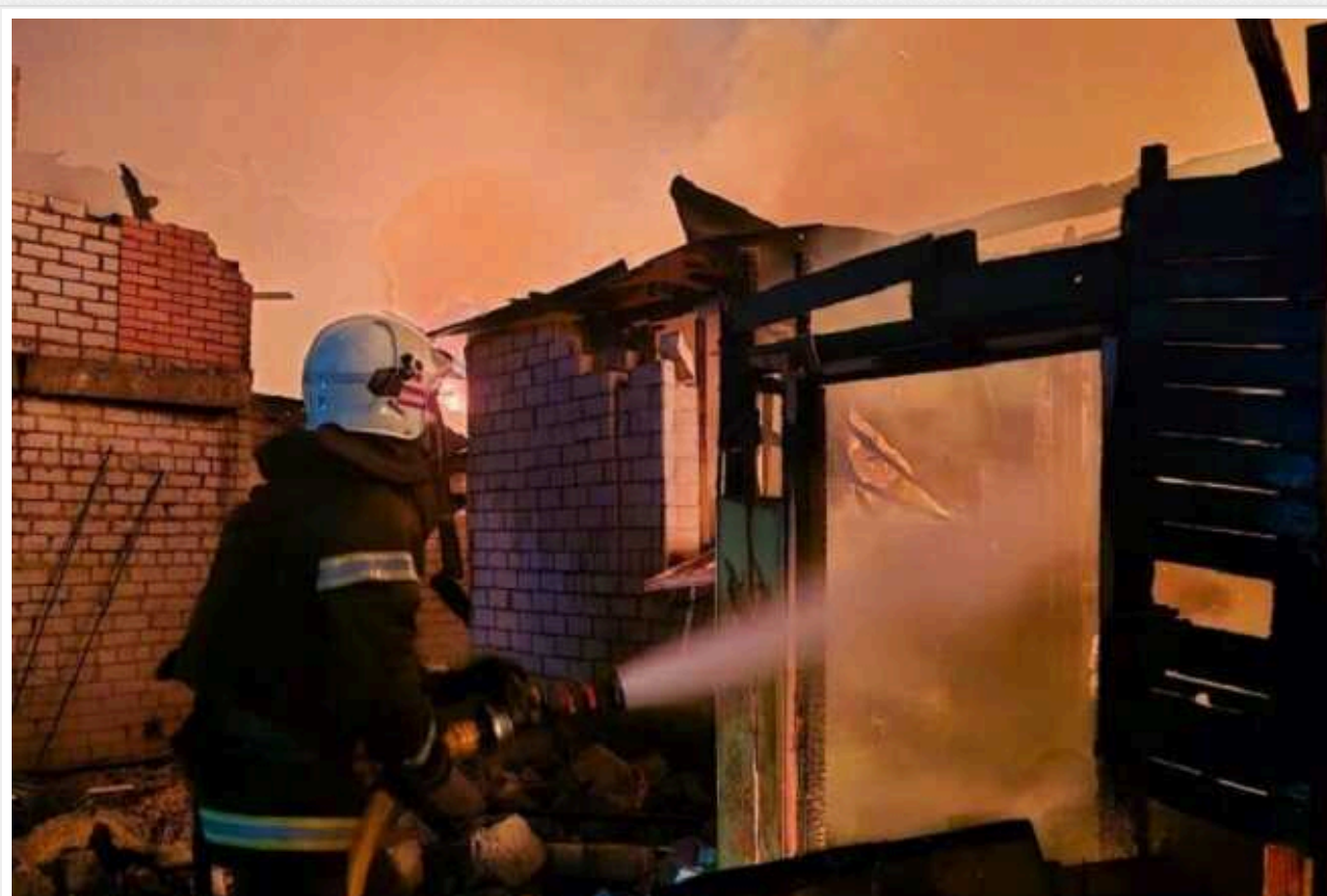
У Харкові зросла кількість постраждалих через обстріл: у Чугуєві поранено дітей

У Харкові зростає кількість постраждалих в результаті нічного обстрілу. Поранення отримали вісім осіб.