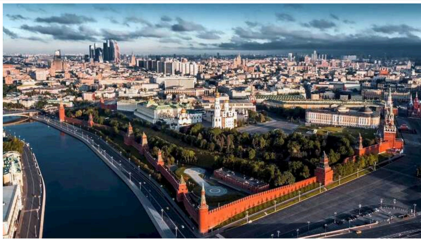
The Guardian: РФ може піти на переговори, якщо ЗСУ зможуть діставати ракетами до Москви

Україна прагне отримати від Заходу дозвіл на використання ракет дальнього радіусу дії Storm Shadow для знищення цілей у глибині Росії. Київ вважає, що це може змусити Москву до переговорів про припинення бойових дій.