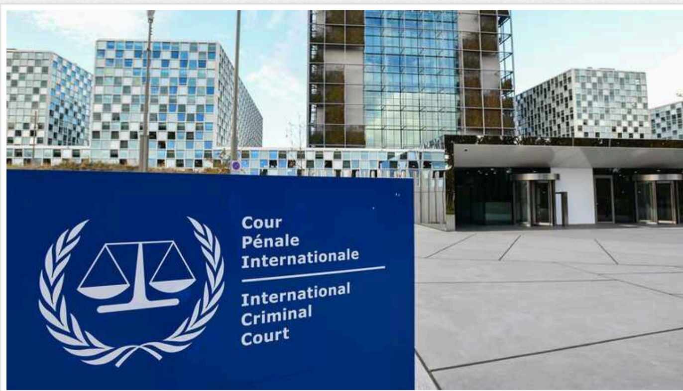
Головний прокурор МКС вимагає від колегії суддів прийняти рішення щодо арешту ізраїльських лідерів

Головний прокурор Міжнародного кримінального суду в п'ятницю закликає суддів "негайно" ухвалити рішення щодо його запиту про ордери на арешт прем'єр-міністра Ізраїлю Бен'яміна Нетаньягу та інших осіб, пов'язаних з війною між Ізраїлем і ХАМАСом. Він стверджує, що суд має відповідну юрисдикцію.