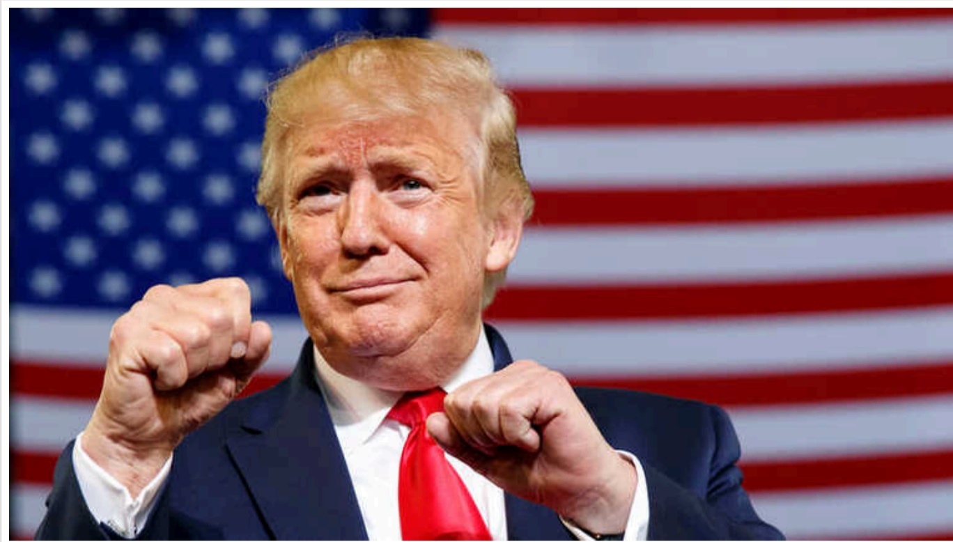
Reuters: Трамп у битві з Гарріс намагається привернути увагу ЗМІ до себе

Кандидат у президенти США від Республіканської партії Дональд Трамп намагається привернути увагу ЗМІ до себе під час боротьби з кандидатом від Демократичної партії Камалою Гарріс.