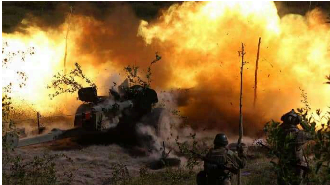
Ситуація на фронті: ворог 33 рази атакував Покровський напрямок і втратив понад 220 військових

Генеральний штаб ЗСУ повідомив про напружену ситуацію на Покровському напрямку, який російські війська атакували протягом доби 33 рази біля семи населених пунктів включно з Покровськом.