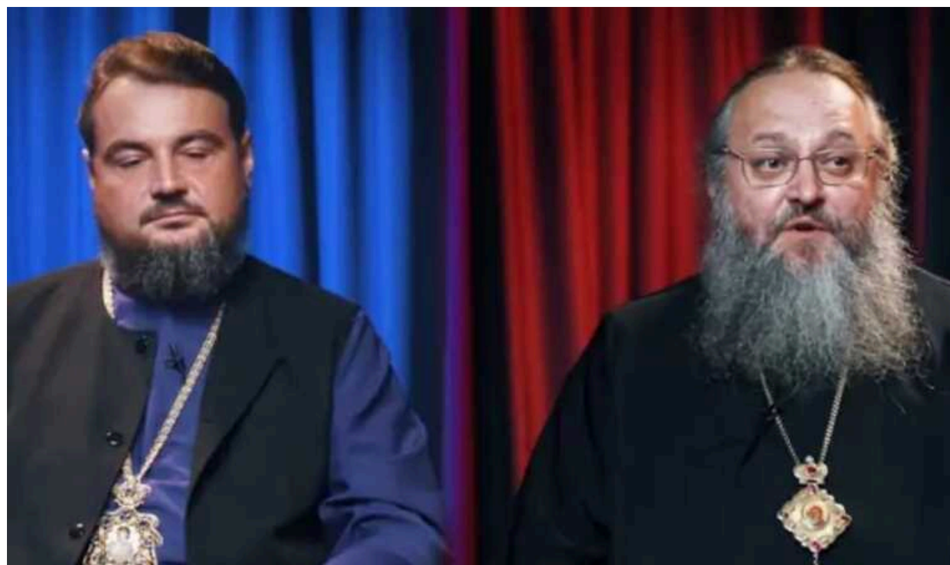
Представники ПЦУ й УПЦ провели дебати

За 27 днів набере чинності новий закон, відповідно до якого релігійні організації з керівним центром у Росії повинні припинити свою діяльність в Україні. Митрополити ПЦУ та УПЦ провели дебати.