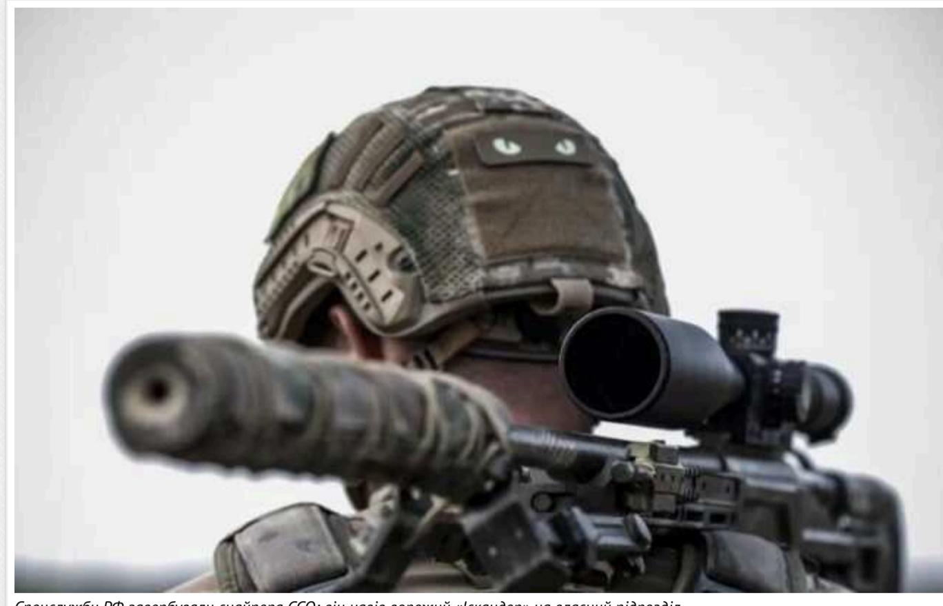
Спецслужби РФ завербували снайпера ССО: він навів ворожий «Іскандер» на власний підрозділ

Про це йдеться у рішенні Шевченківського райсуду Києва.