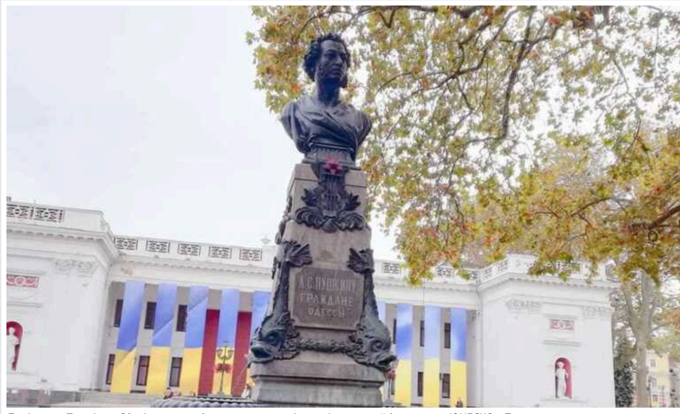
Пам'ятник Пушкіну в Одесі не можна демонтувати, оскільки він внесений до реєстру ЮНЕСКО, - Труханов

Таку заяву зробив мер міста Геннадій Труханов.