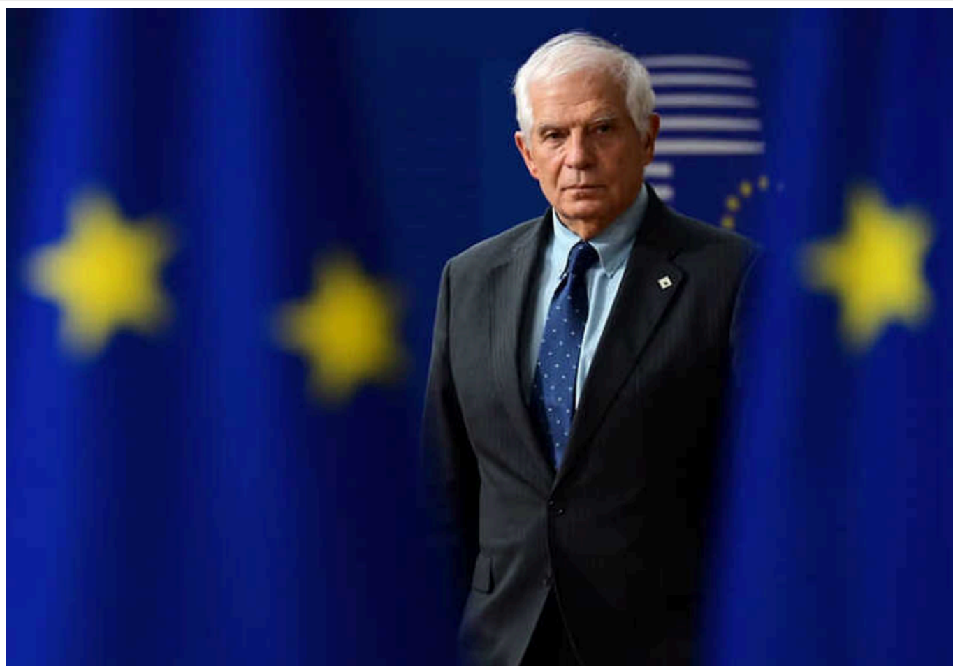
Боррель охарактеризував ЄС як "учасника гри" в Україні та "частиною конфлікту"

Цю інформацію озвучив високий представник Євросоюзу із зовнішніх справ і політики безпеки.