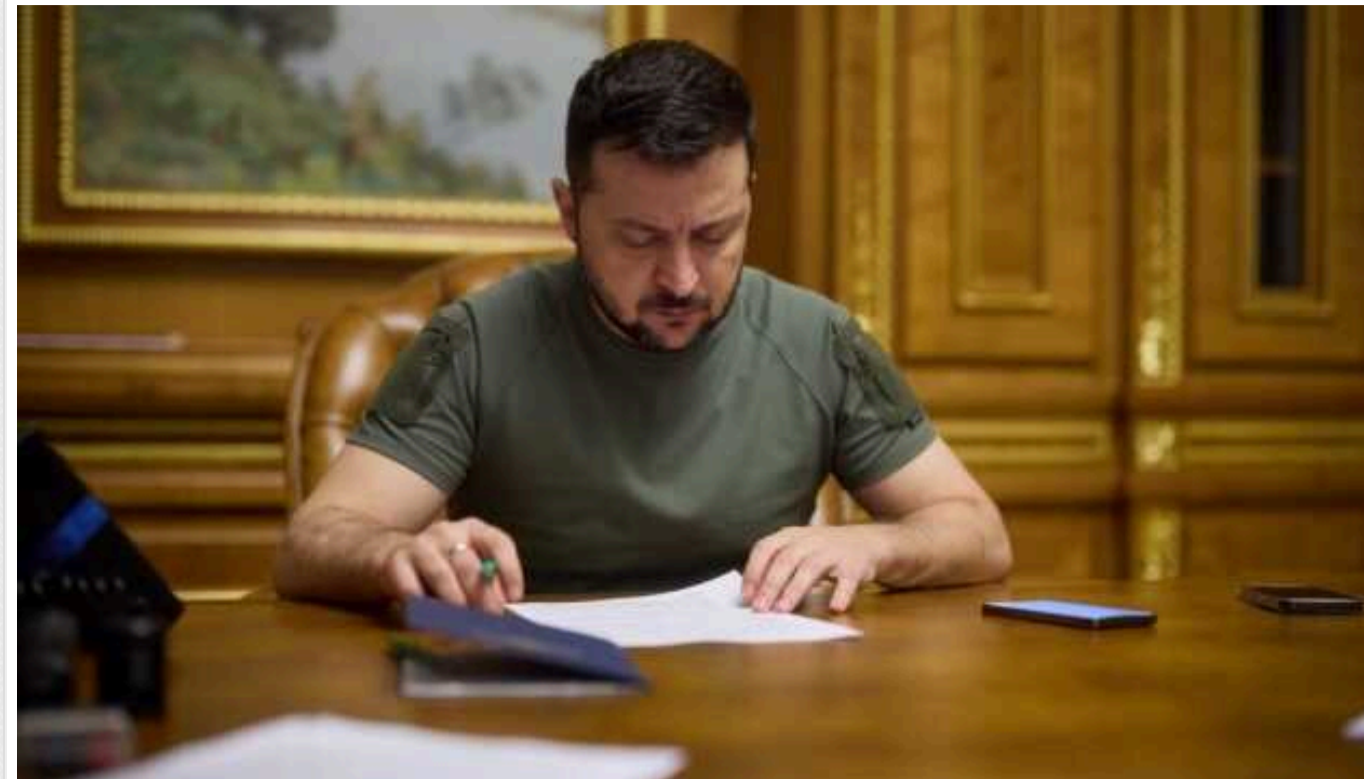
Закон про заборону РПЦ в Україні передано на підпис Зеленському

Закон про заборону Російської православної церкви (РПЦ) та організацій, пов'язаних з нею, в Україні, який Рада прийняла 20 серпня, було передано на підпис президентові Володимир Зеленському.