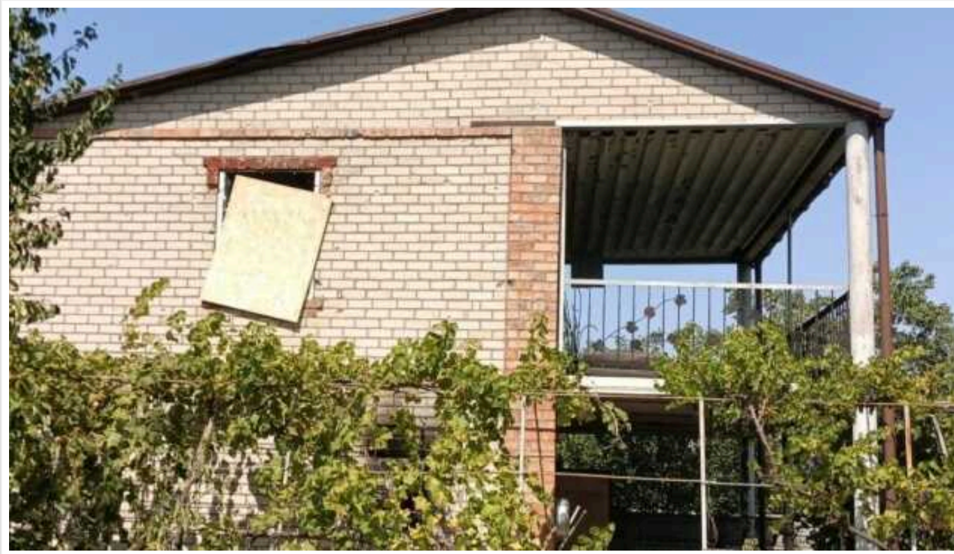
Окупанти завдали ударів дронами та артилерією по Нікопольщині: постраждали інфраструктура, магазин і ЛЕП

Російські військові обстріляли Нікопольщину за допомогою дронів та артилерії. Внаслідок атаки постраждала інфраструктура, два приватні будинки, магазин та лінія електропередач.