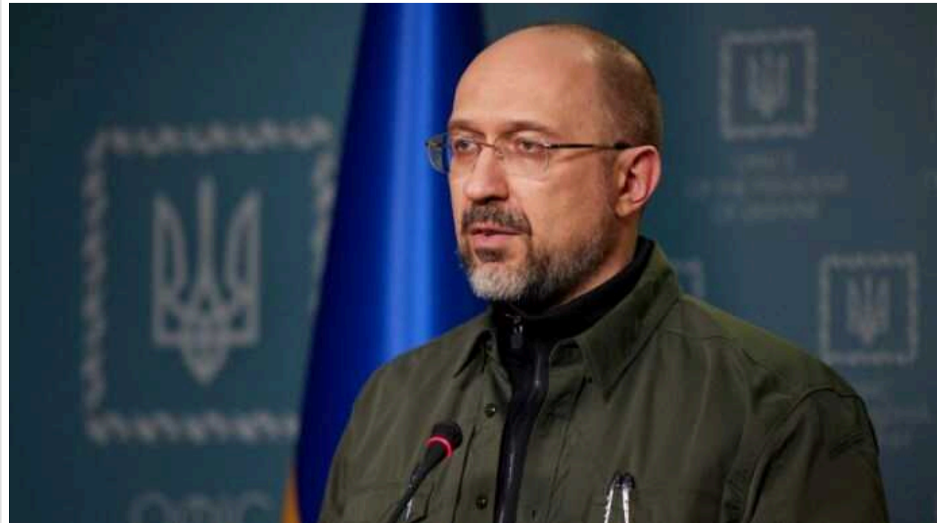
Шмигаль дав доручення Міноборони та МОЗ врегулювати проходження ВЛК пораненими військовими

Військовослужбовцям, які отримали поранення, ще минулого року спростили процедуру проходження військово-лікарської комісії. Проте й досі є випадки, коли захисники, які зазнали травм на фронті, змушені самотійно відвідувати ВЛК. Прем'єр-міністр Денис Шмигаль доручив Міністерствам охорони здоров'я та оборони з'ясувати, чому це відбувається.