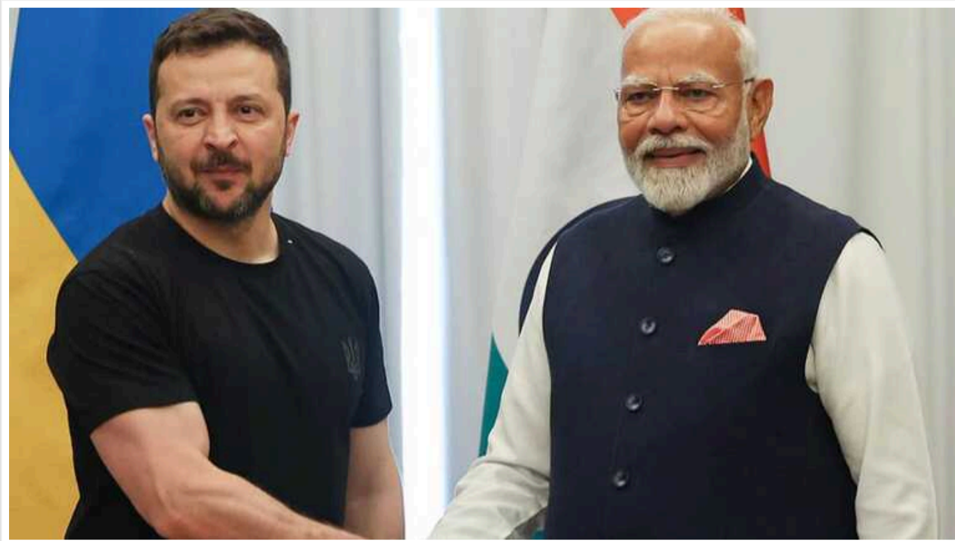
Для миру в Україні Індія готова зробити активний внесок, - Моді

Індія відстоює необхідність дипломатичного врегулювання війни Російської Федерації проти України. Нью-Делі готовий активно долучитися до досягнення миру в Україні.