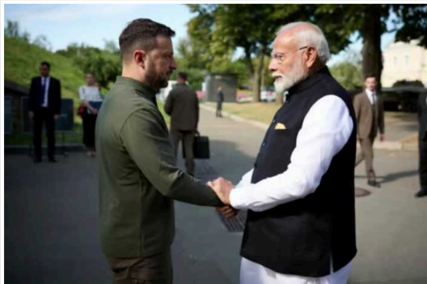
Україна та Індія домовились про чотири угоди щодо співпраці

Під час візиту прем'єр-міністра Індії Нарендрі Моді в Україну було досягнуто угод про співпрацю в медичній, аграрній, гуманітарній та культурній сферах.