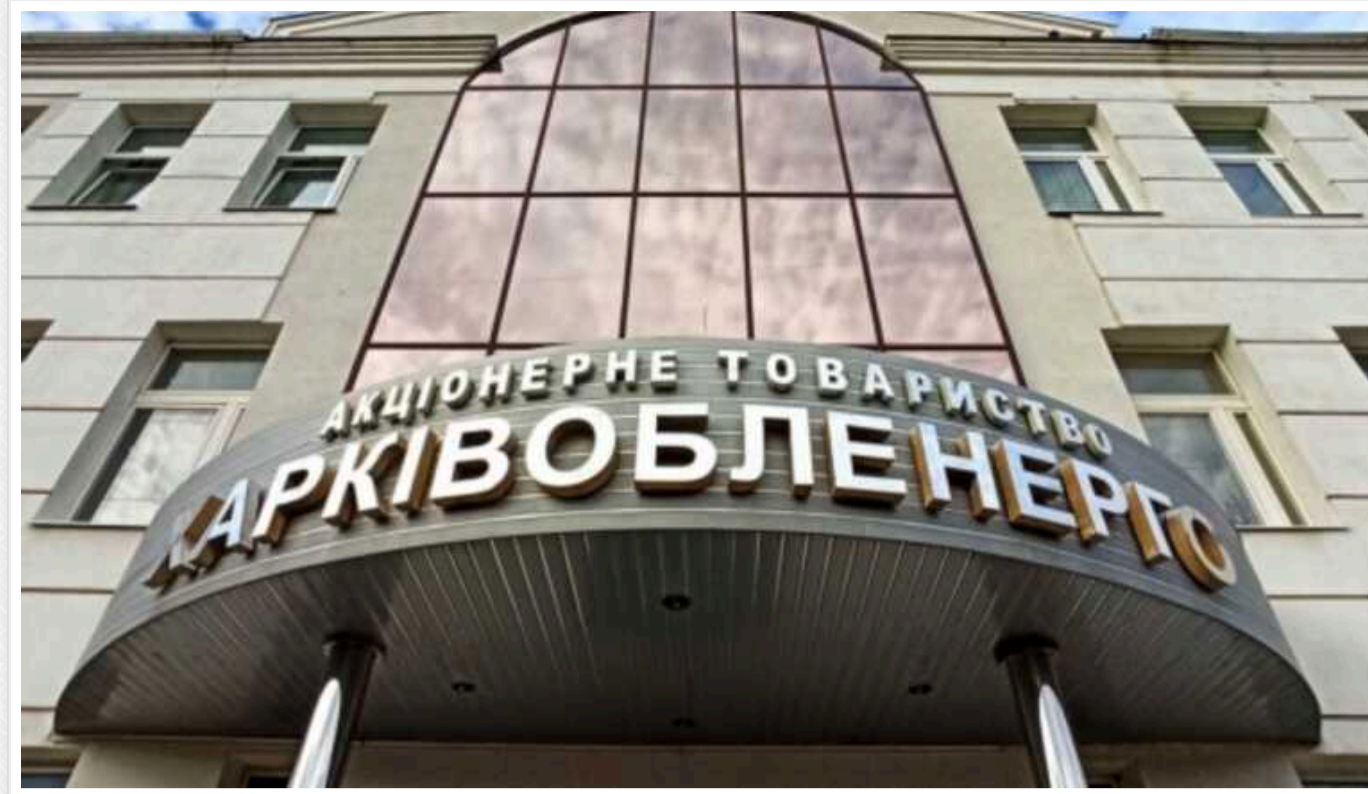
У справі щодо мільйонних розкравань у «Харківобленерго» з'явилися нові підозрювані

Про це стало відомо з повідомлення НАБУ та САП.