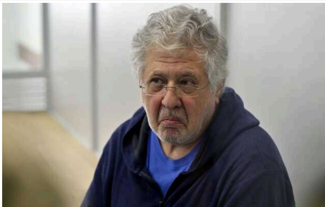
БЕБ "пробачило" Коломойському 1,3 мільярда гривень

На початку серпня БЕБ повідомило Ігорю Коломойському про підозру в заволодінні понад 5,3 мільярда гривень. Однак вже 21 серпня в публікаціях БЕБ, без згадки імені олігарха, фігурує істотно менша сума — 4 мільярди.