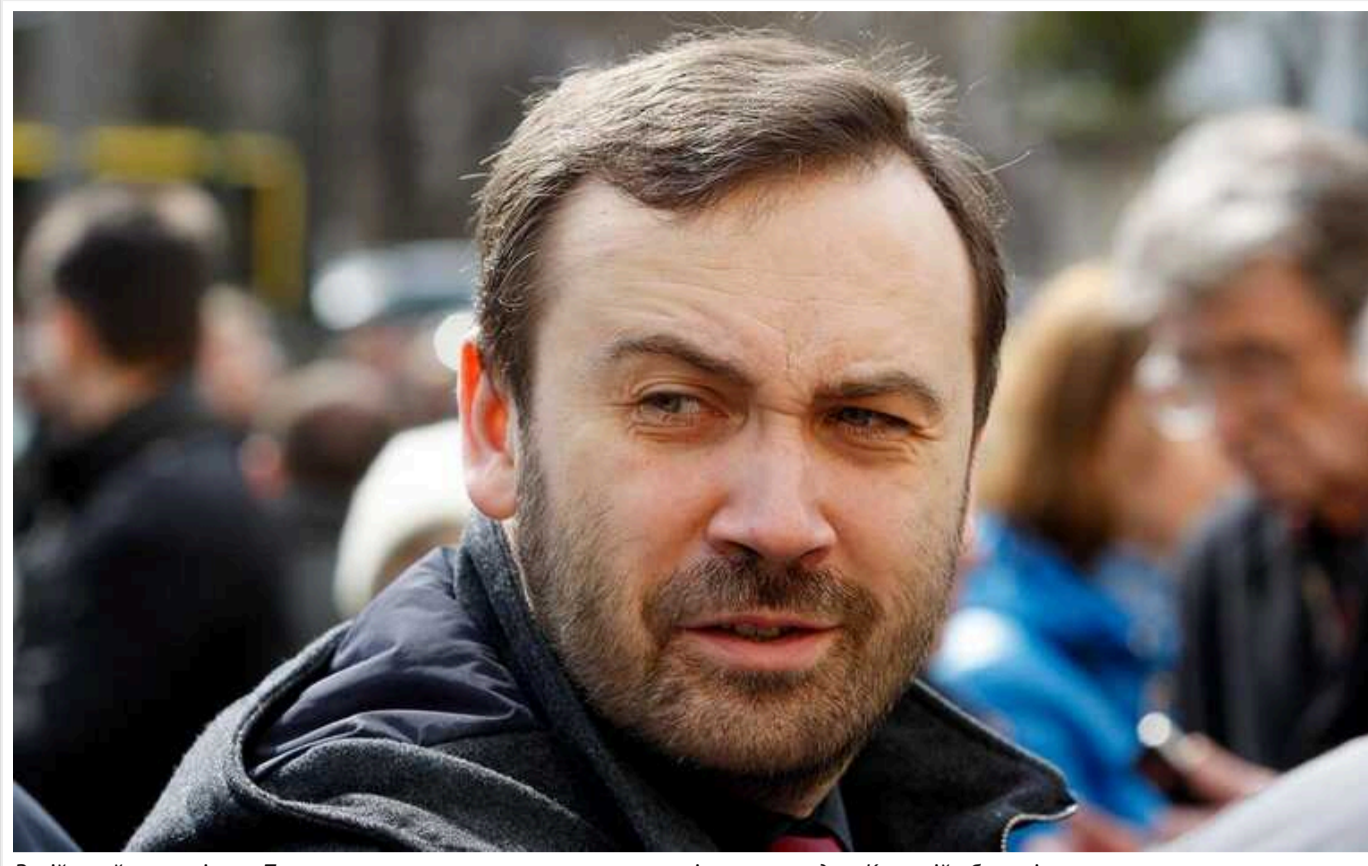
Російський опозиціонер Пономарьов хоче очолити альтернативні органи влади у Курській області

Російський опозиціонер Ілля Пономарьов звернувся із закликом дозволити йому очолити альтернативні органи влади у Курській області, яка перебуває під контролем ЗСУ.