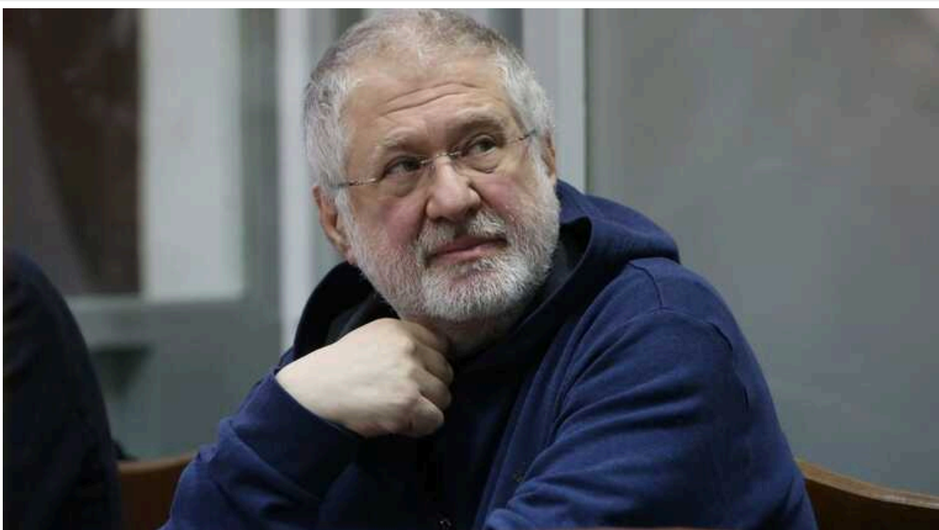
БЕБ завершило розслідування щодо Коломойського

Детективи БЕБ, під процесуальним керівництвом Офісу Генерального прокурора, завершили розслідування щодо бізнесмена Ігоря Коломойського та колишнього керівника кийської філії одного з банків за звинуваченням у заволодінні мільярдами гривень і легалізації доходів.