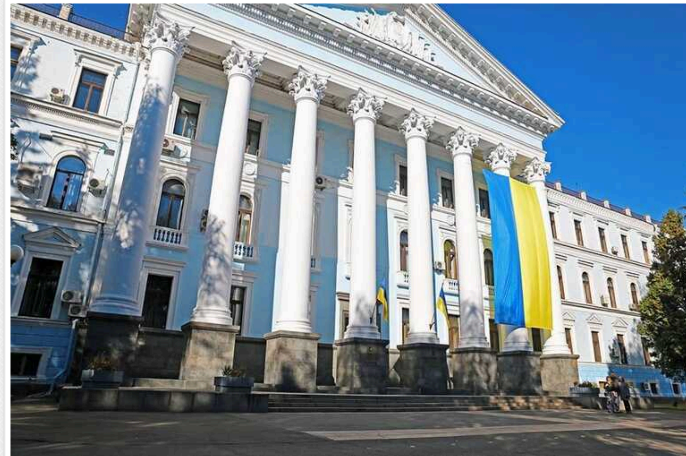
Магія і нічого крім магії. Із кримінального провадження щодо корупції в Міноборони зник нинішній чиновник Нацбанку?

Слідчі Державного бюро розслідувань під час розслідування кримінального провадження проти екзаступника міністра оборони України Вячеслава Шаповалова не згадали про його колишнього радника Павла Поляруша, який нині очолює Управління роботи з проблемними активами Нацбанку України.