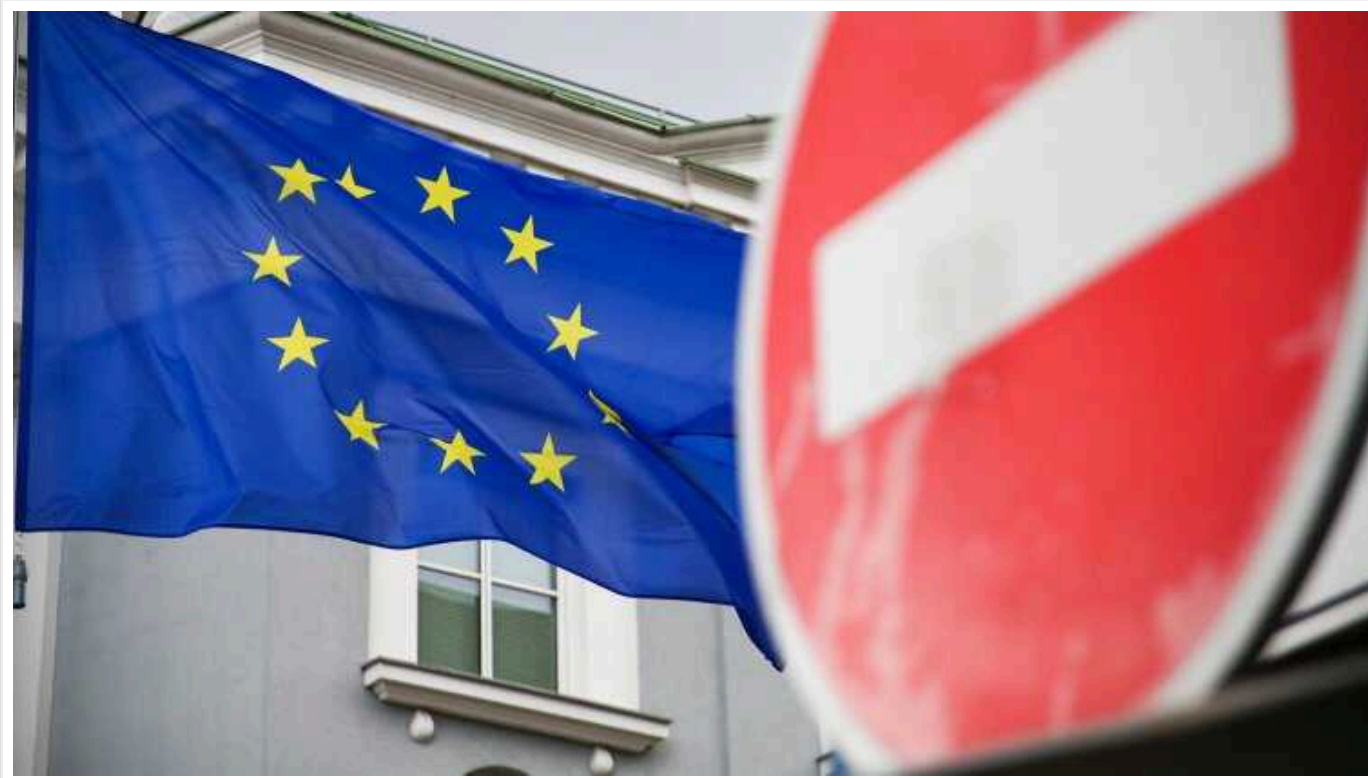
Швейцарія приєдналася до чергового пакету санкцій ЄС проти Росії

Швейцарія вирішила запровадити проти Росії обмеження, передбачені 14-м пакетом санкцій Євросоюзу.