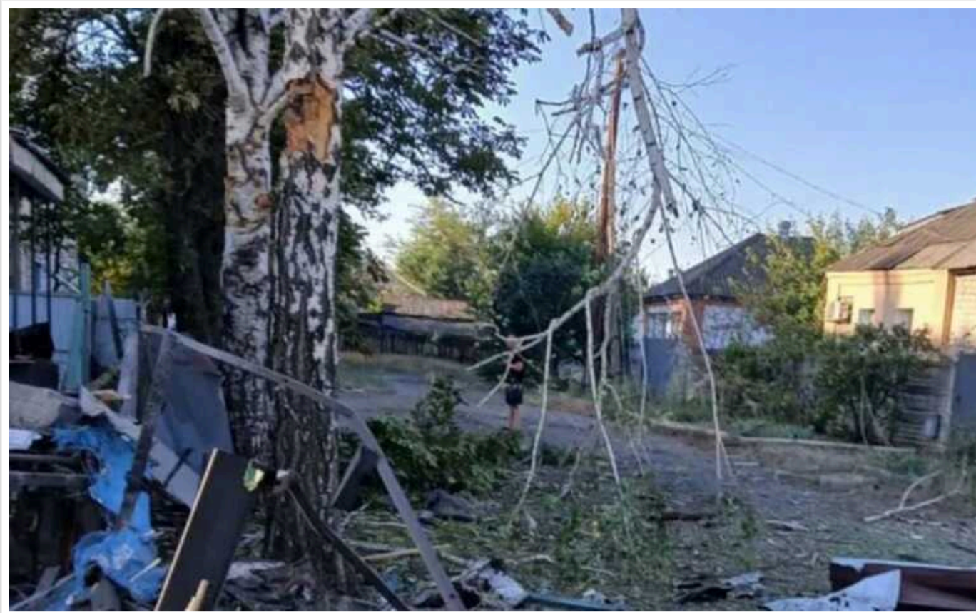
Окупанти атакували сільську раду в Козачій Лопані на Харківщині: під завалами можуть бути люди

Вдень 21 серпня російські війська завдали удару по селищу Козача Лопань Дергачівської громади Харківської області. Під завалами, за попередніми даними, опинилися троє людей.