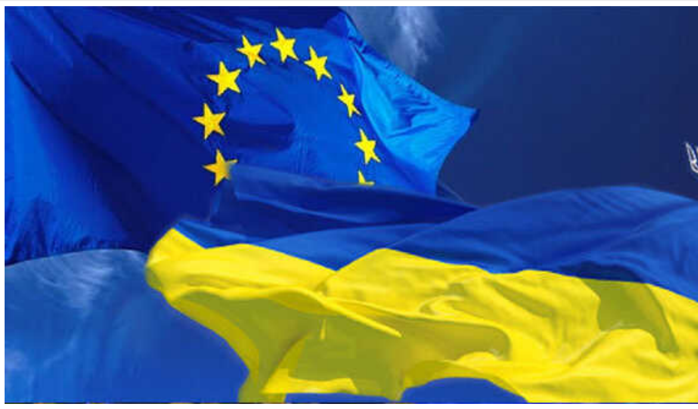
Україна долучається до програми ЄС з протидії шахрайству

Верховна Рада ратифікувала угоду між Україною та Європейським Союзом про участь у програмі ЄС щодо боротьби зі шахрайством (EUFAP).