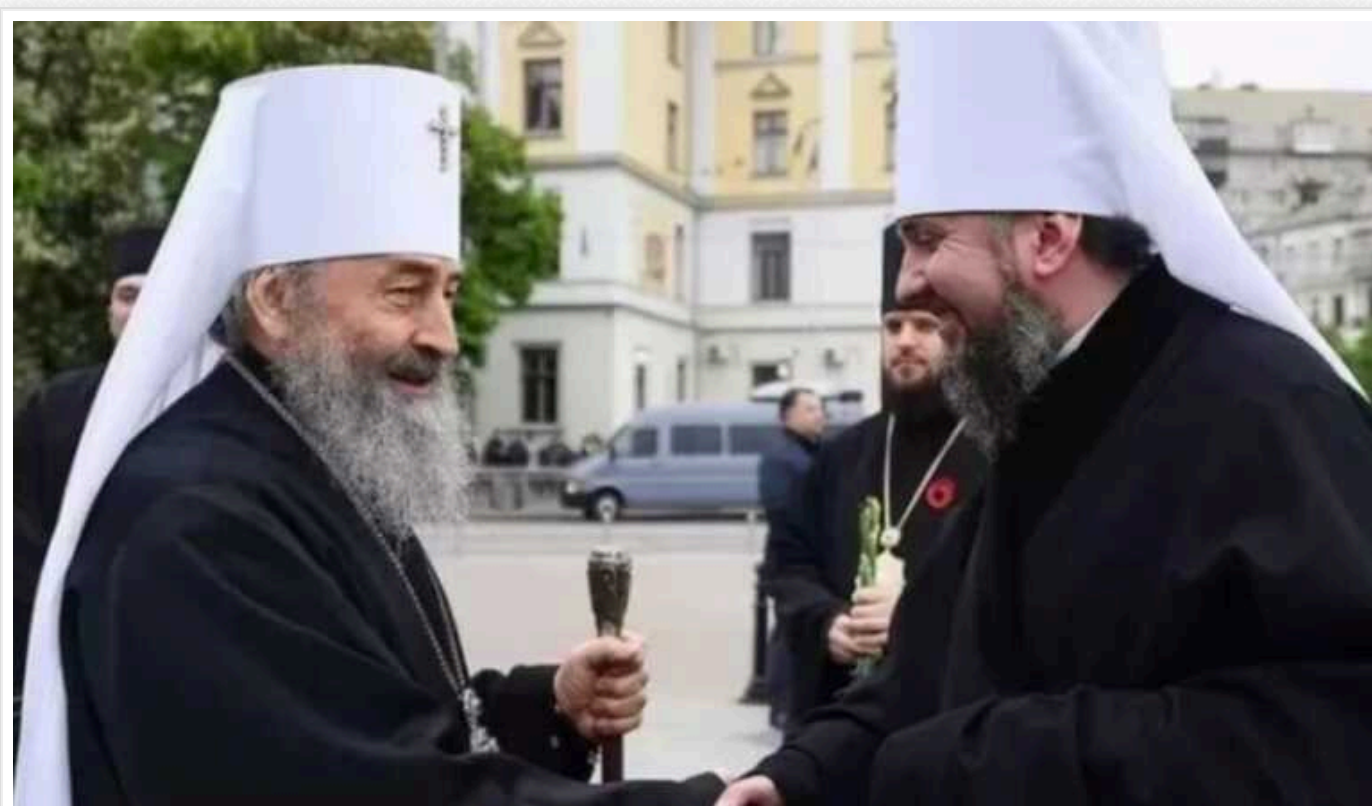
З'явилася реакція представників ПЦУ та УПЦ МП після заборони РПЦ

Релігійні організації, що мають керівний центр у Росії, мають припинити свою діяльність в Україні. В УПЦ вже заявили, що закон про заборону РПЦ та пов'язаних із нею організацій не відповідає Конституції. ПЦУ ухвалення закону схвалює.