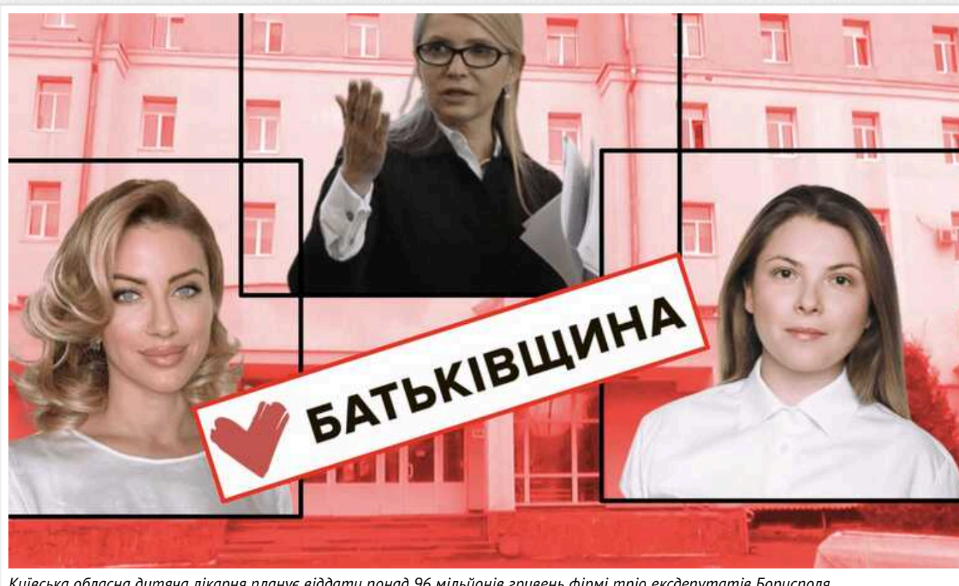
Київська обласна дитяча лікарня планує віддати понад 96 мільйонів гривень фірмі тріо ексдепутатів Борисполя

В Київській обласній дитячій лікарні в Боярці стартують капремонтні на двох поверхах, де планують розмістити операційні та відділення онкогематології.