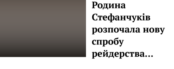
Родина Стефанчуків розпочала нову спробу рейдерства...