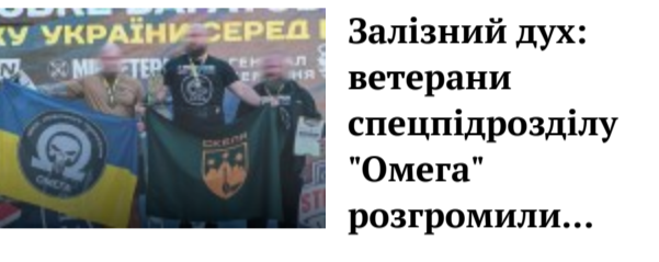
Залізний дух: ветерани спецпідрозділу "Омега" розгромили...