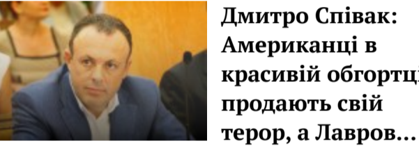
Дмитро Співак: Американці в красивій обгортці продають свій терор, а Лавров...