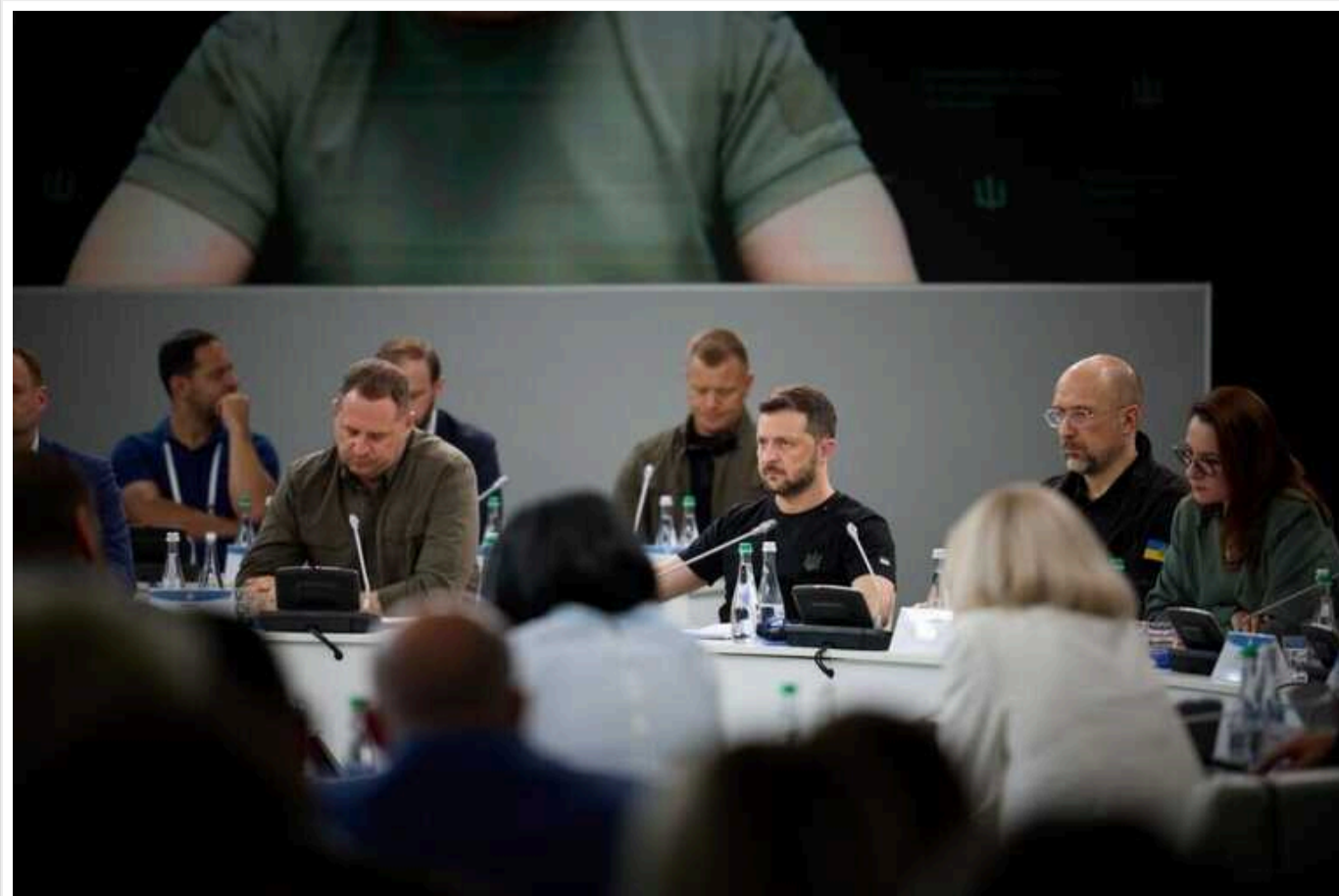
Зеленський відвідав Конгрес місцевих і регіональних рад й озвучив ключові виклики

У Кропивницькому відбулось нове засідання Конгресу місцевих і регіональних влад при президентові України. Основними темами нової зустрічі були можливості державних програм в енергетиці, створення альтернативних джерел енергопостачання, підготовка якнайбільшої кількості закладів освіти до роботи в офлайн-режимі та співпраця з партнерами в Євросоюзі.