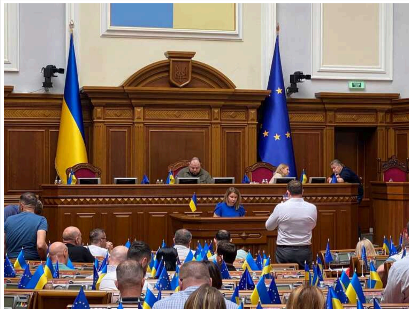
ВР дозволила іноземцям, які захищають Україну, жити в країні, попри проблеми з документами

Нардепи підтримали законопроект про правовий статус іноземців і осіб без громадянства, які воюють проти РФ.