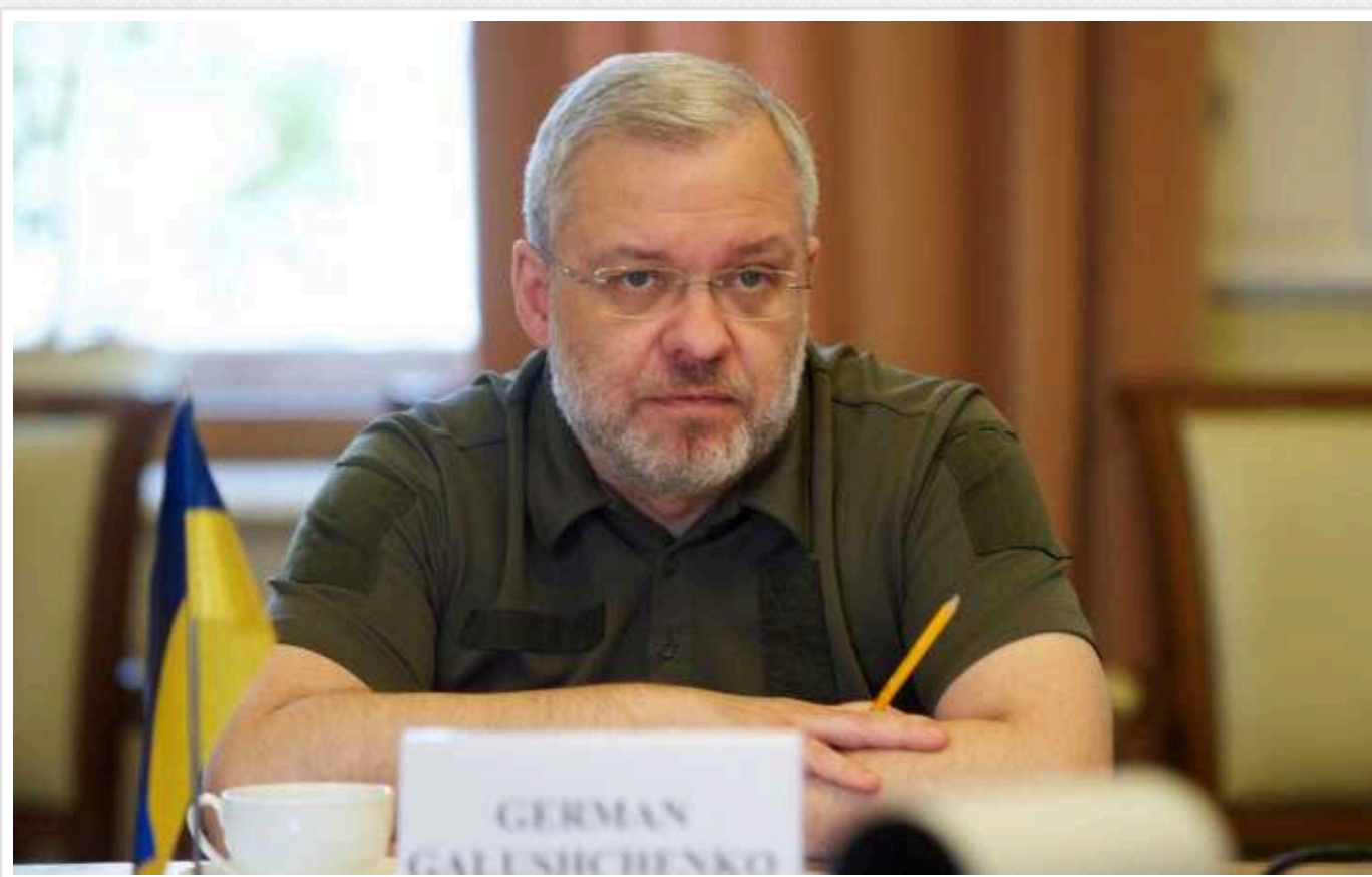
Міністра енергетики Галуценка терміново викликали до ВР

Народні обранці терміново викликали до Верховної Ради міністра енергетики Германа Галуценка. Відповідно до вимог депутатів, 21 серпня він повинен представити доповідь щодо участі міністерства у протидії корупції в енергетичному секторі.