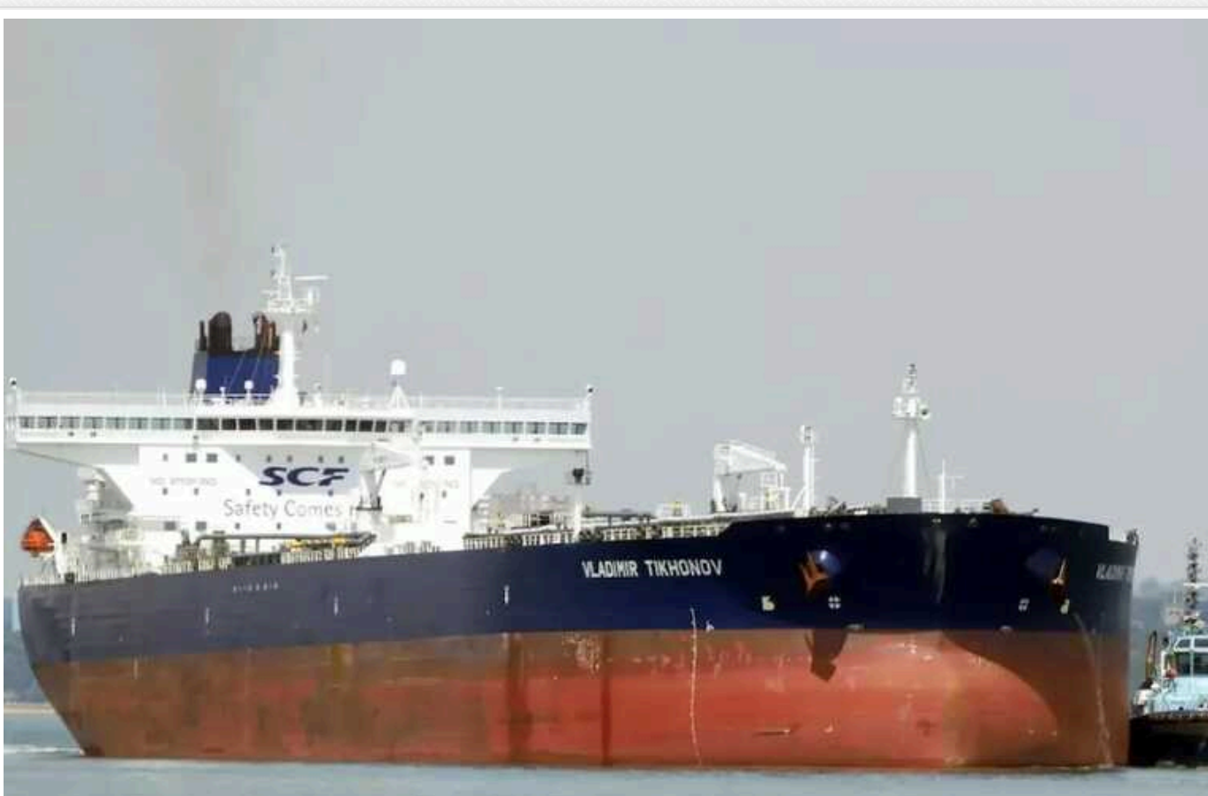
Україна не ввела санкції проти "тіньового флоту" РФ, - ЗМІ

В Україні не запроваджено санкцій проти конкретних танкерів, які використовує РФ для обходу західних санкцій у торгівлі нафтою. Росія сформувала потужний "тіньовий флот" задля уникнення західних санкцій. Наразі санкційна політика потребує введення санкцій проти конкретних танкерів, які задіяні в експорті нафти в обхід санкцій.