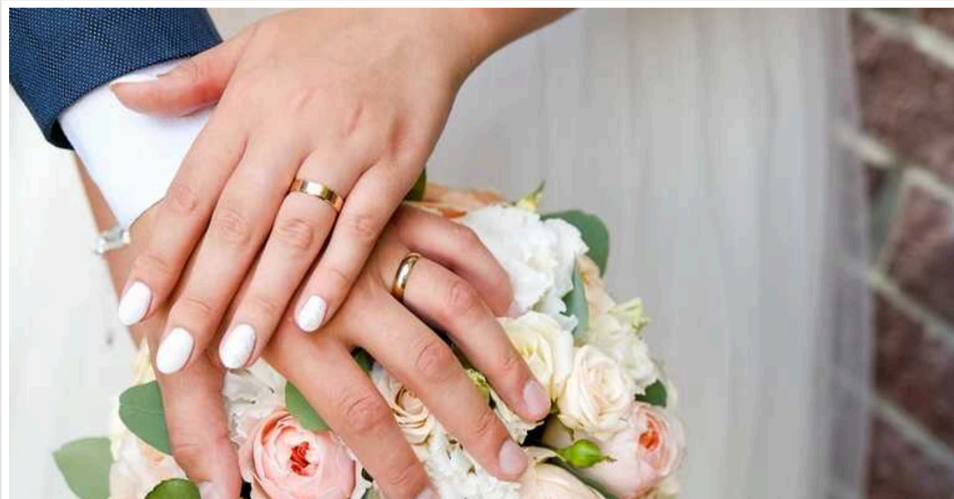
Федоров оголосив про презентацію послуги онлайн-одруження через відеозв'язок у "Дії"

Міністр цифрової трансформації Михайло Федоров анонсував запуск нової послуги на порталі "Дія". Йдеться про можливість одружитися онлайн - через відеозв'язок.