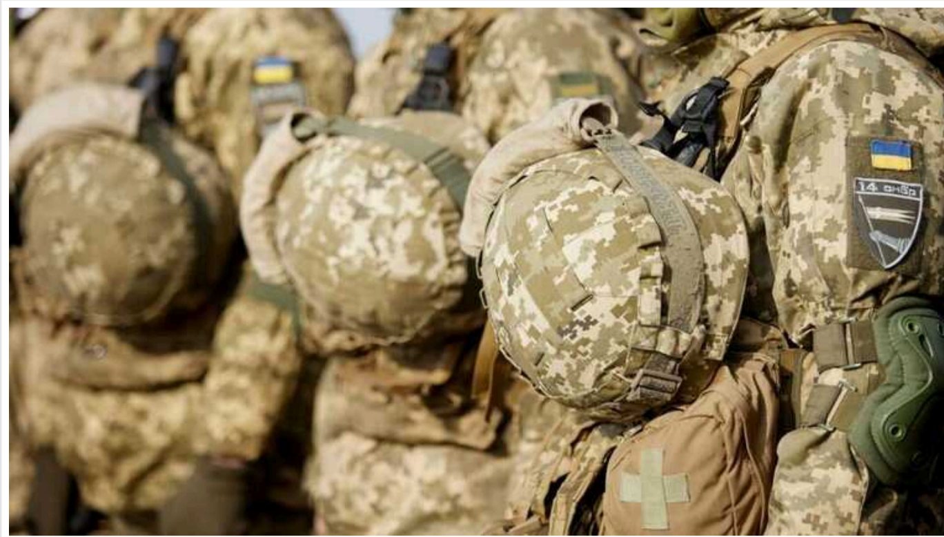
В Україні планують розширити перелік громадян, які мають право на відстрочку

Комітет національної безпеки, оборони та розвідки підтримав законопроект про внесення змін до закону України "Про мобілізаційну підготовку та мобілізацію" щодо розширення кола військовозобов'язаних громадян, які можуть отримати відстрочку від призову до армії.