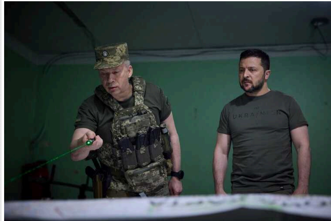
Сирський приховав від Єрмака та Заходу план щодо Курської області: розмовляв із Зеленським наодинці, – The Economist

Західних союзників, стверджує джерело журналістів, також навмисно не інформували, адже дві попередні операції Олександра Сирського були "злиті" нібито партнерами.