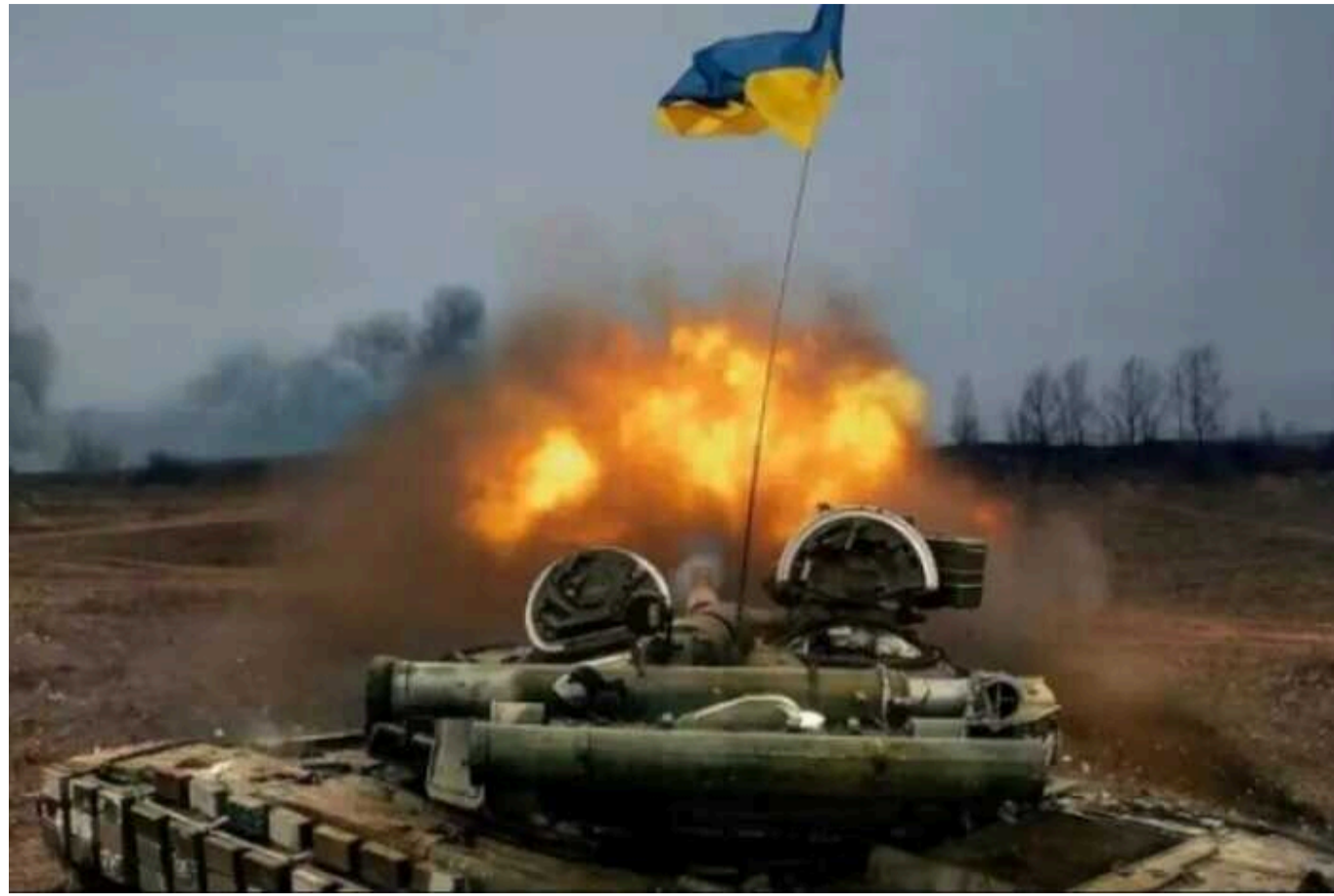
Ситуація на фронті: за минулу добу відбулося 145 боїв, найбільша активність на Покровському напрямку

Протягом минулої доби на фронті було зафіксовано 145 бойових зіткнень, що свідчить про активізацію бойових дій на кількох напрямках.