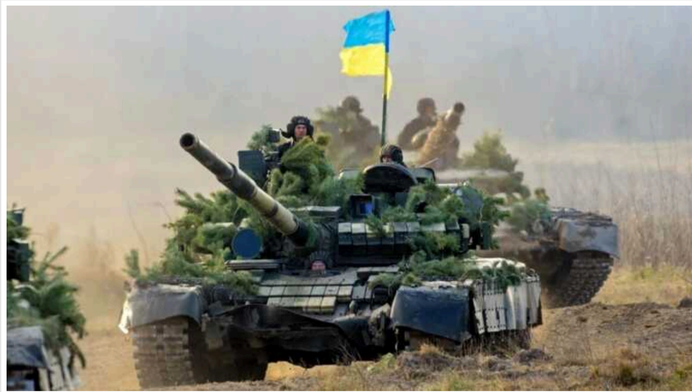
На Харківському напрямку від початку доби тривають чотири бої, – ОТУ «Харків»

Сили оборони України продовжують стримувати російські війська на Харківському напрямку, де противник намагається наступати, але безуспішно.