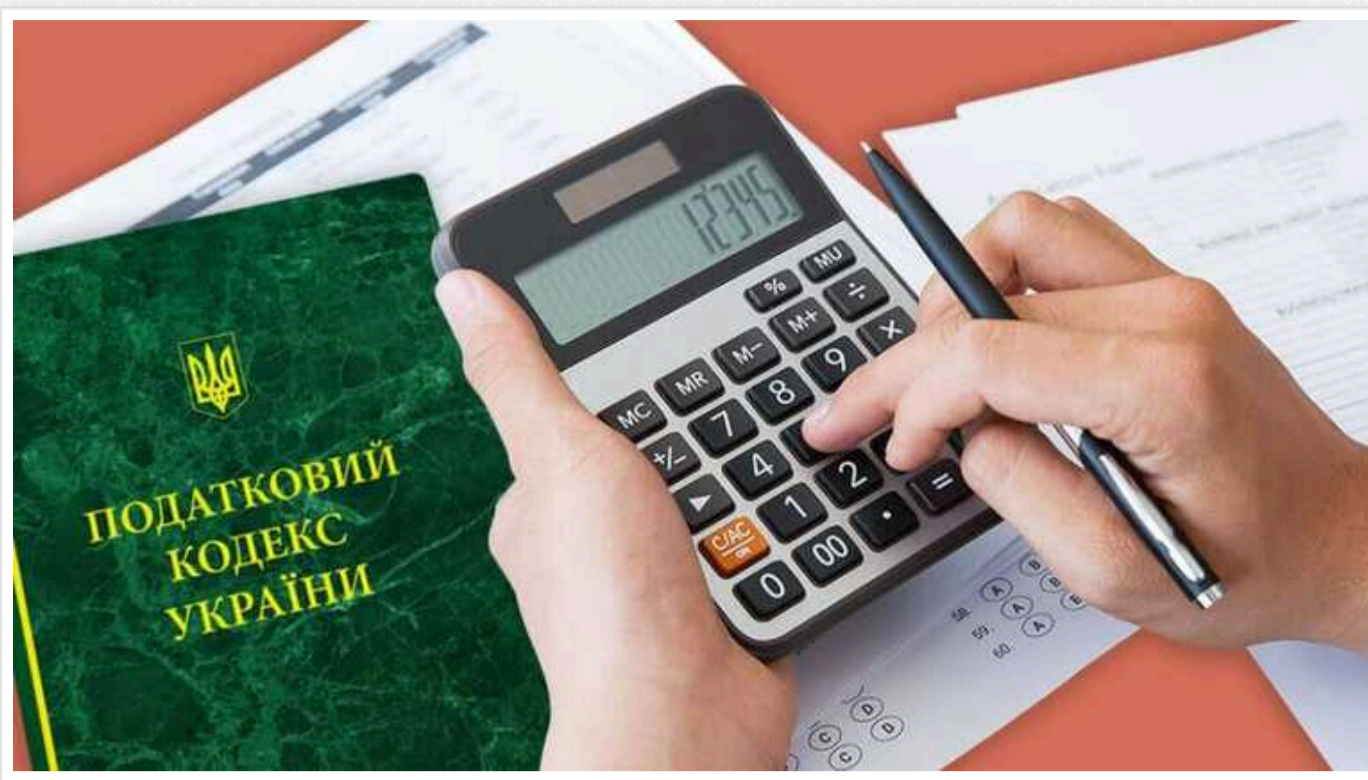
Законопроект про підвищення податків: у Forbes назвали основні зміни

В Україні завершуються роботи над змінами до податкового законопроекту, необхідного для фінансування Сил оборони.