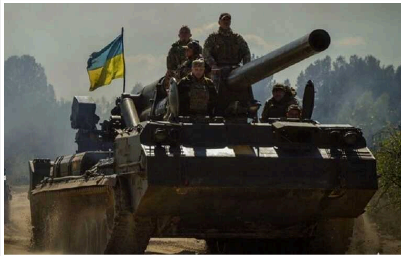
В ССО показали, як знищують російських військових на Курщині

У неочікуваному наступі ЗСУ в Курській області беруть участь і бійці Сил спеціальних операцій. Вони показали, як нищать військових країни-агресора.