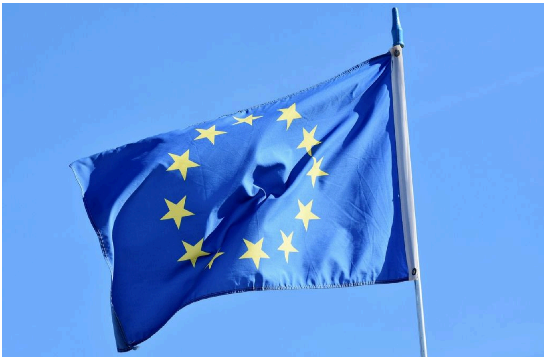
ЕС / © pixabay.com

КАРПЕЦЬ ОЛЕКСАНДР — 27 Травня 2026, 10:10 2 Mins Read — УКРАЇНА