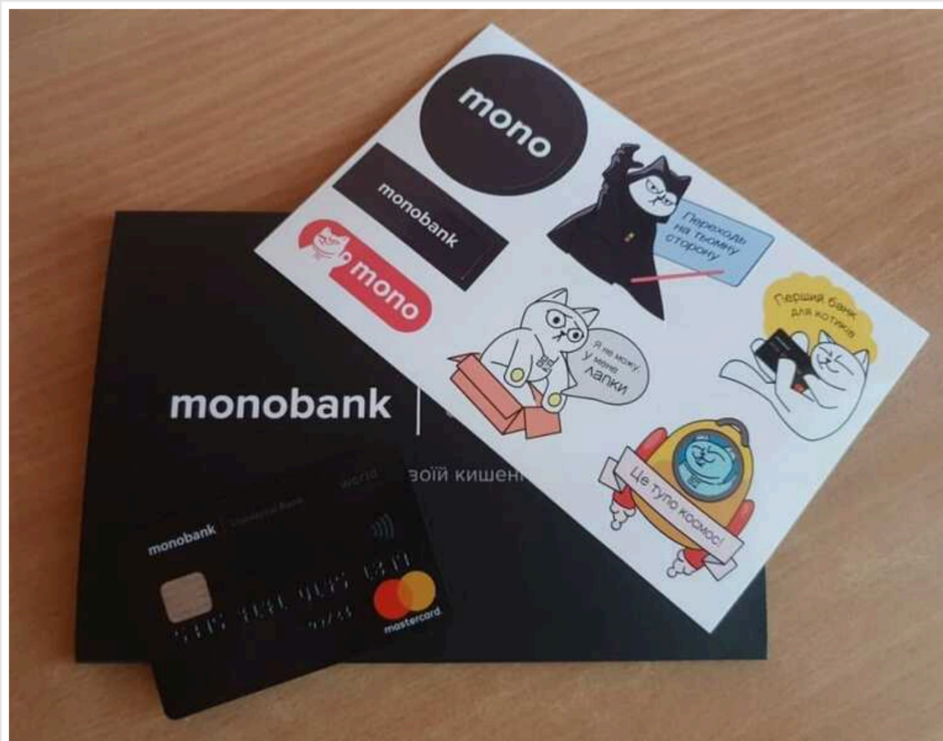
Третій день поспіль Монобанк під потужною DDOS-атакою: до вирішення проблеми долучилися спецслужби

Вже третій день поспіль Монобанк перебуває під масштабною DDOS-атакою, яка почалась увечері 16 серпня. Ця кібератака стала однією з найбільших за всю історію банку, і її масштаби вражають навіть фахівців Amazon Web Services (AWS), які підключилися до вирішення проблеми.