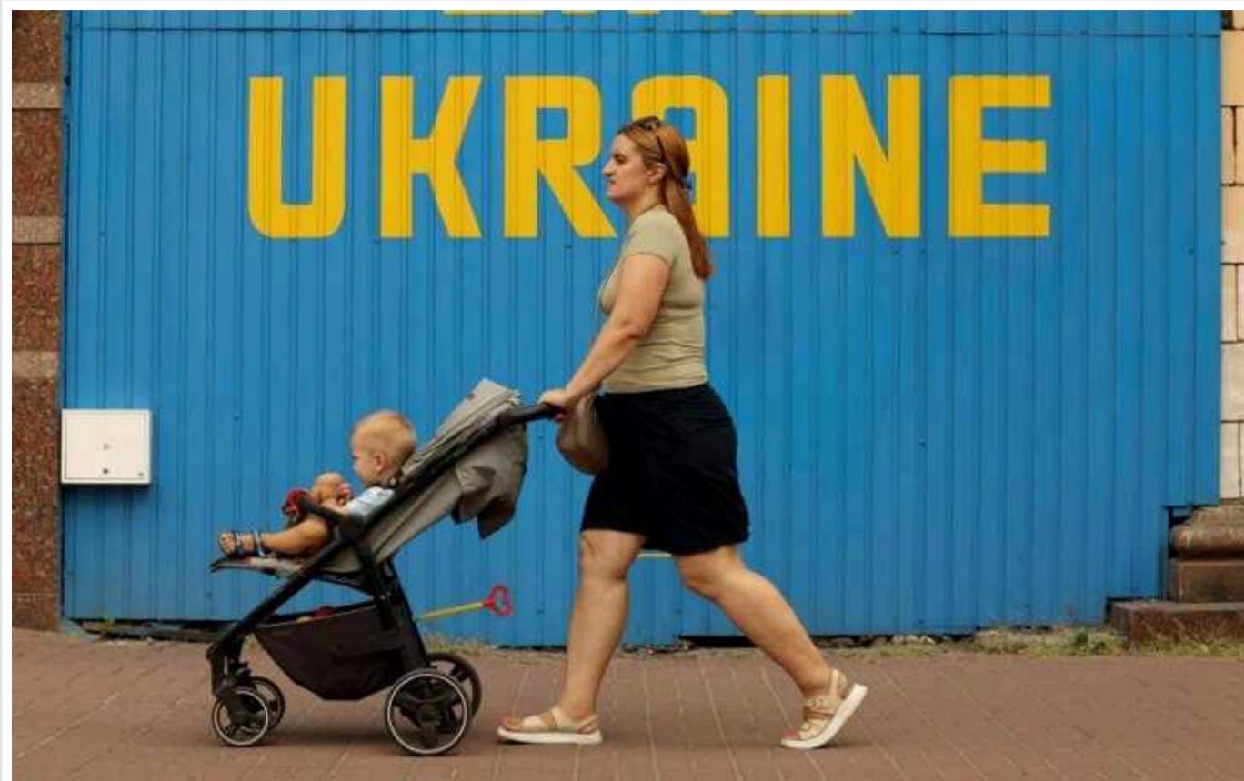
У Верховній Раді пропонують створити в Україні Національну демографічну агенцію

Утримання нового органу – Національної демографічної агенції – буде вартувати близько 272 млн на рік.