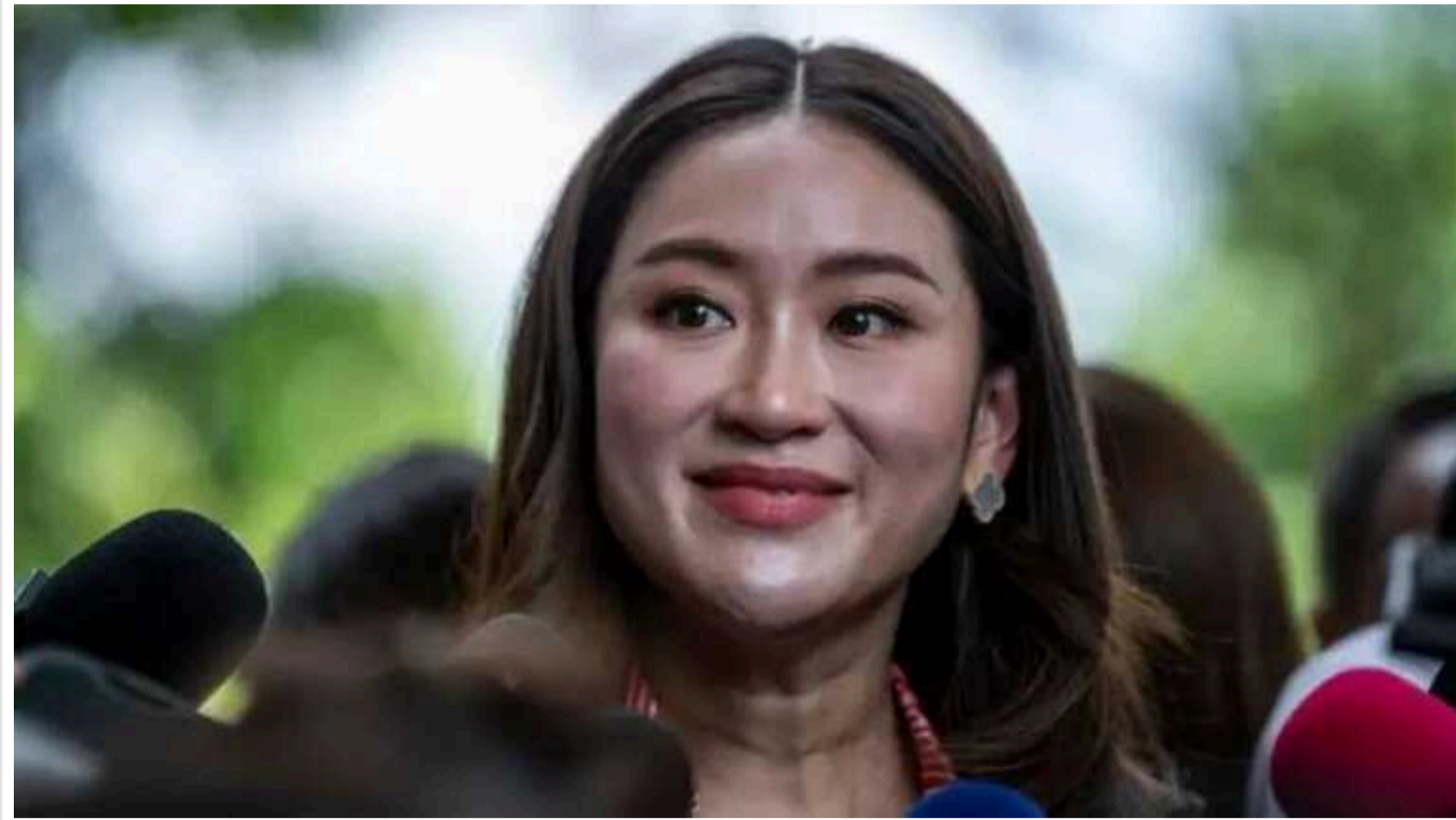
У Таїланді на посаду прем'єр-міністра призначили 37-річну доньку експрем'єра

Новим, 31-м за рахунком прем'єр-міністром Таїланду стала Пхетхонтхан Чинават, 37-річна лідерка ліберально-консервативної популістської партії «Пхія Тхаї» та дочка відомого політика, який раніше обіймав цю посаду. Вдруге в історії королівства жінці довірено очолити уряд, повідомляє "Бі-бі-сі".