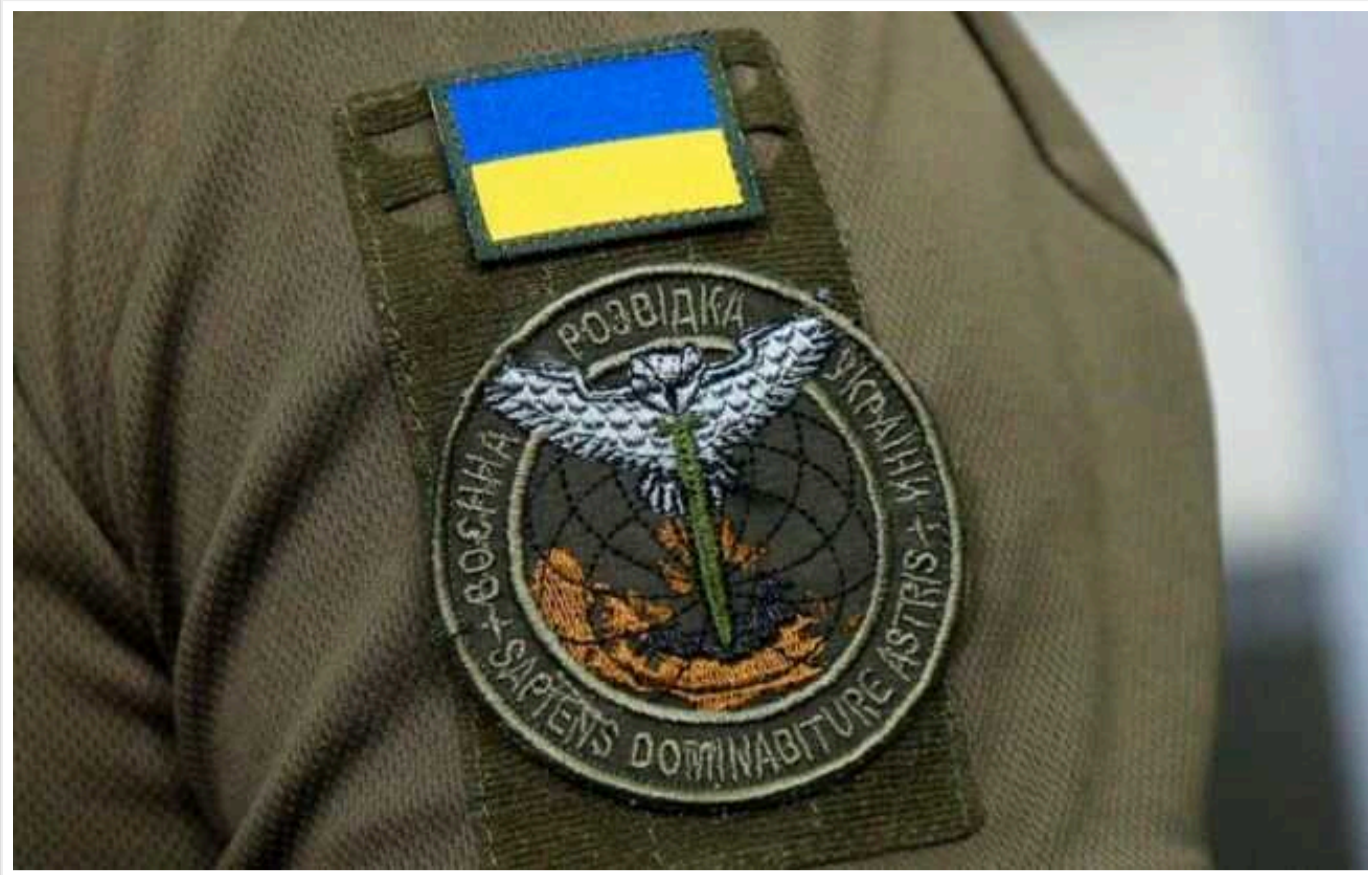
ГУР паралізувало в РФ роботу підприємства-розробника ядерної зброї

Кіберфахівці ГУР МОУ спільно з хакерською групою "VO Team" продуктивно попрацювали під Челябінськом (РФ) та паралізували роботу підприємства, яке розробляє ядерну зброю держави-агресорки Росії.