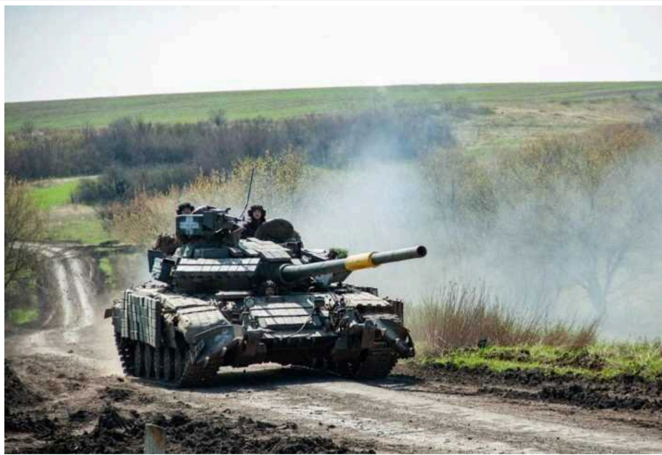
Ситуація на фронті: За суботу росіяни штурмували на Покровському напрямку вже 25 разів

З початку доби на фронті відбулося 72 бойових зіткнення, найактивніше росіяни атакують на Покровському напрямку, де нараховано 25 спроб ворога потіснити захисників із займаних позицій.