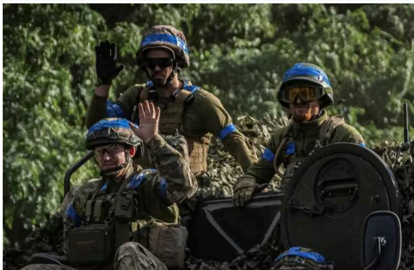
NYT: Західні чиновники радили Україні не проводити цього року великих наступів

Про це повідомляє газета New York Times .