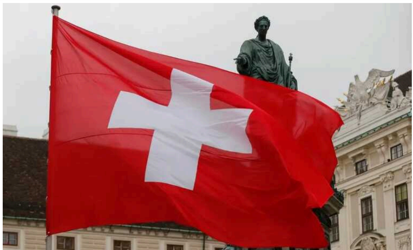
Швейцарія ввела санкції до громадян, причетних до репресій у Білорусі

Федеральна рада Швейцарії в середу, 14 серпня, запровадила санкції проти 27 громадян Білорусі, причетних до репресій проти демократичних активістів, а також пропагандистів і бізнесменів режиму.