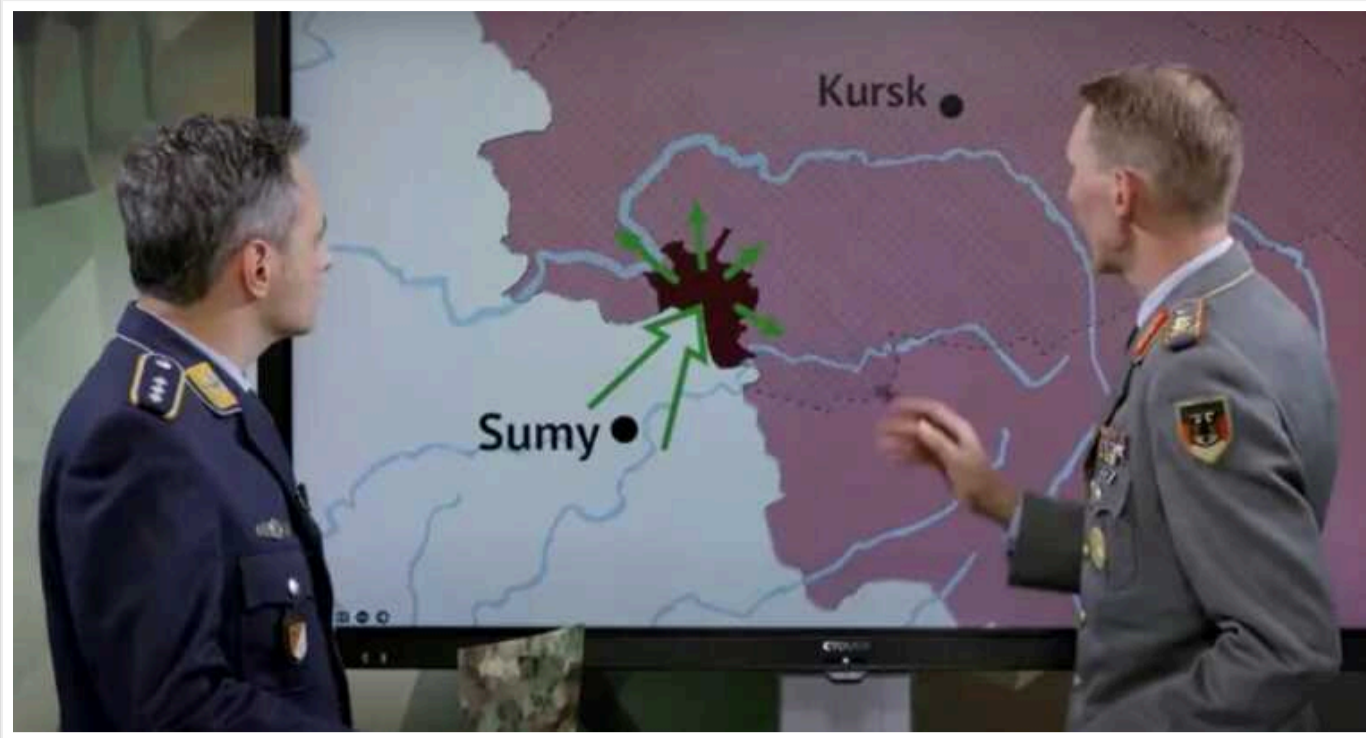
Німецький генерал показав напрямки наступу ЗСУ на Курську область

Німецький генерал проаналізував бойові дії в Курській області і зауважив, що їм передувала велика підготовка і серйозна розвідка. З його слів, проти росіян воєне уєрупування з 4–6 тисяч військових, і воно має усі шанси на успіх.