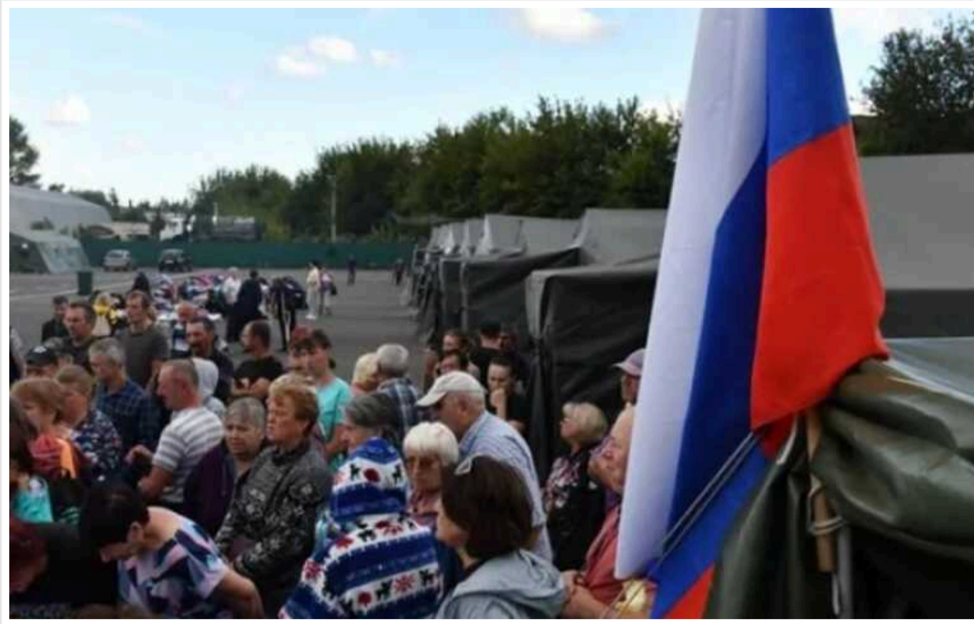
У РФ у соцмережі заблокували групу, в якій шукали зниклих у Суджі

Група з'явилася тільки 13 серпня. До цього своїх рідних і строковиків жителі Курської області шукали хаотично, у різних групах.