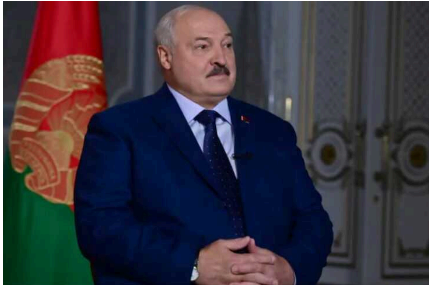
Лукашенко розповів, як обороняє російський і білоруський кордони

Самопроголошений президент Білорусі дав велике інтерв'ю для російського телеканалу. Заявив, що білоруси і росіяни – один народ. І описав, як саме прикриває "російський тил".