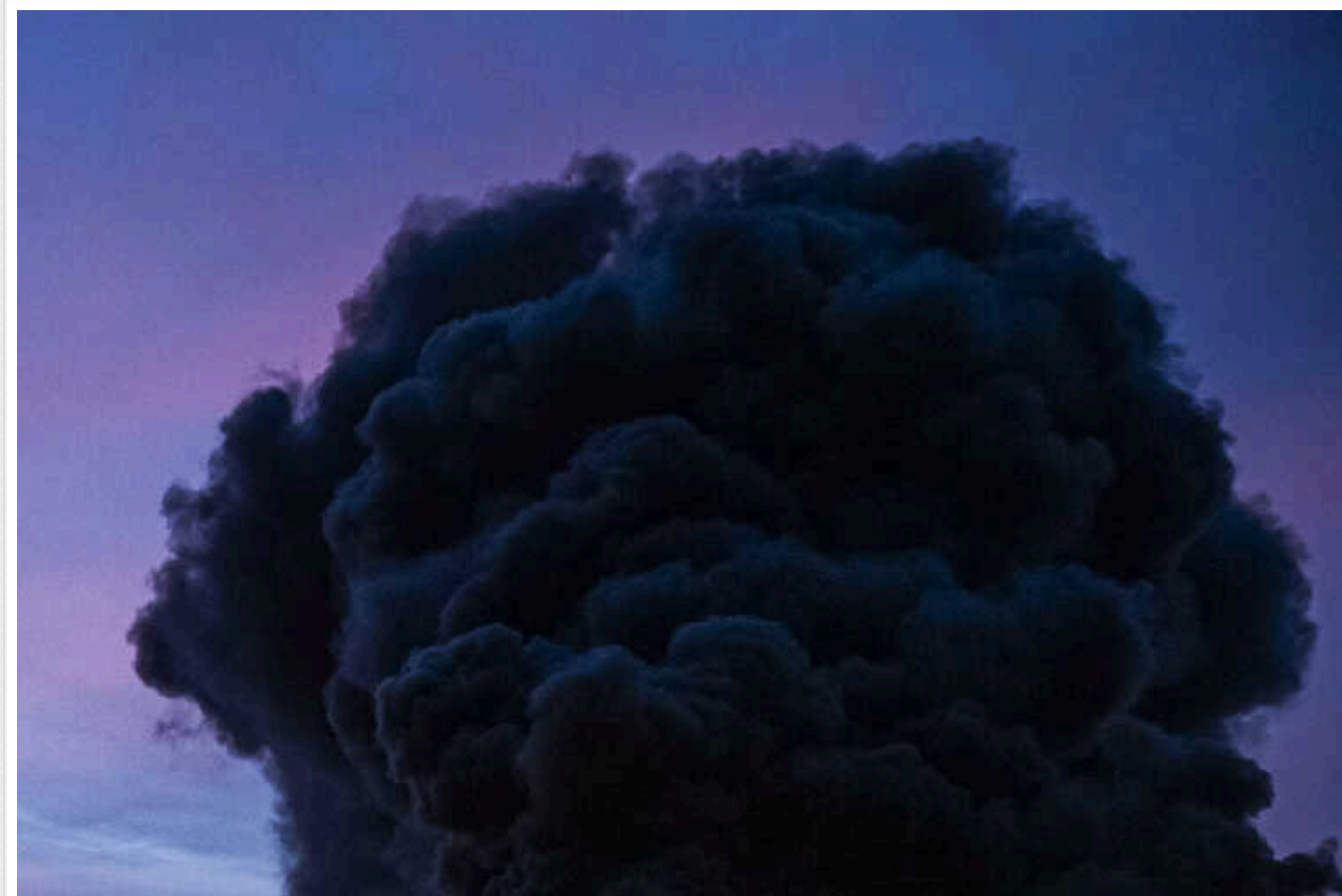
У Запоріжжі та Кривому Розі пролунали вибухи

Пізно ввечері, 15 серпня, у Запоріжжі та у Кривому Розі було чути звук вибуху. До цього військові попереджали про загрозу балістики з півдня.