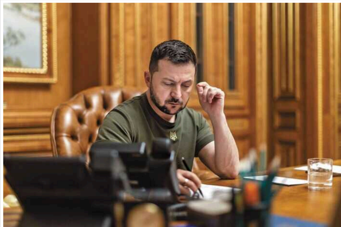
Військові, які беруть участь в операції на території РФ, будуть отримувати всі виплати та преференції, - Зеленський

Президент України Володимир Зеленський вніс до Верховної Ради законопроект, згідно з яким військові, які беруть участь в операції на території РФ, зокрема у Курській області, будуть отримувати всі виплати та преференції, які передбачені для передової.